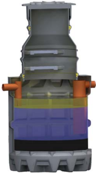
GREASLY vertikal/ modus/