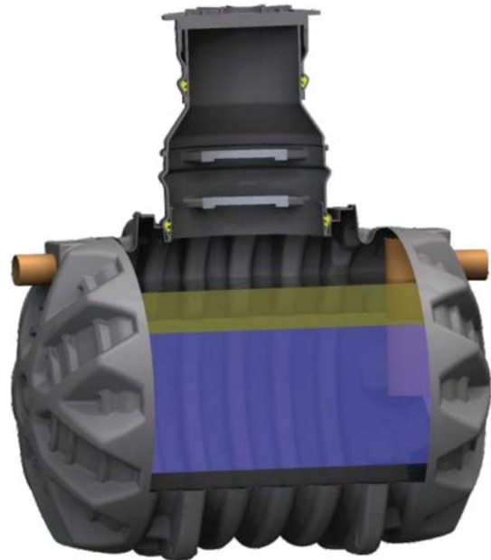
GREASLY horisontal modus/