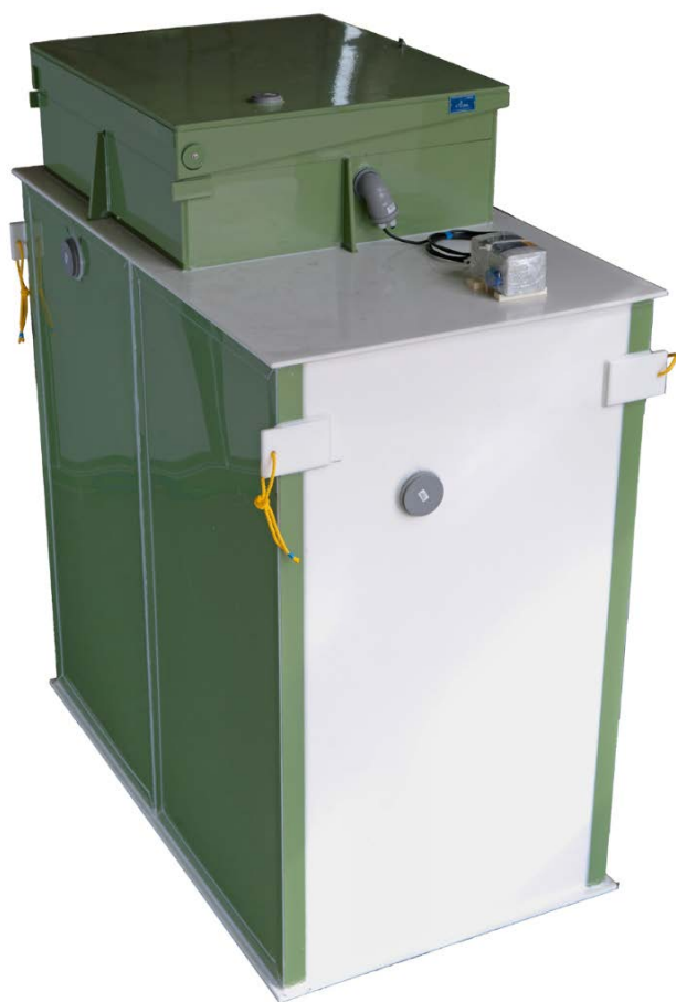
Fig. 1 Topas Plus 7 minirensesanlegg

Topas Plus minirensesanlegg er et anlegg for rensing av avløpsvann. Anlegget består av en enkelt tank med rektangulær grunnflate som er inndelt i ulike prosesskamre. En illustrasjon av anlegget er vist i Figur 1. Produktet er CE-merket i henhold til EN 12566-3:2016.